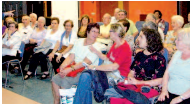
Vista del público asistente a la conferencia.