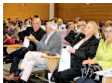
Público asistente a la conferencia en Valencia