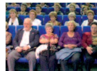
Vista general del pública de la conferencia en Leganes