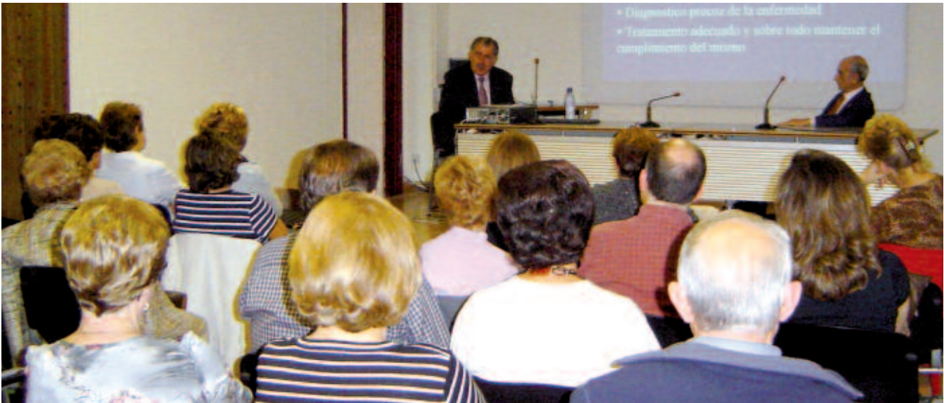
Público asistente a la conferencia.

pérdida de masa ósea es fundamental para prevenir sufrimiento innecesario, así como para reducir los costes sanitarios. La decisión para realizar esta prueba debe estar basada en un perfil individual de riesgo y sólo se realizará si el resultado de la misma puede seguirse de una decisión terapéutica.